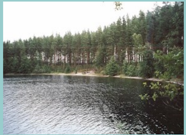
Linnasaaren laguunin hiekkarantaa