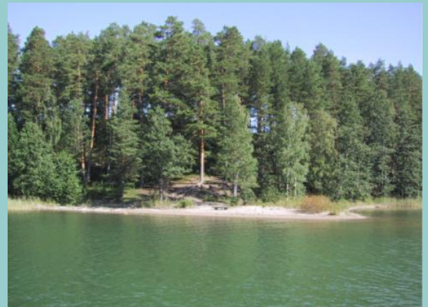
Hiekkarannalle pääsee suurillakin veneillä.