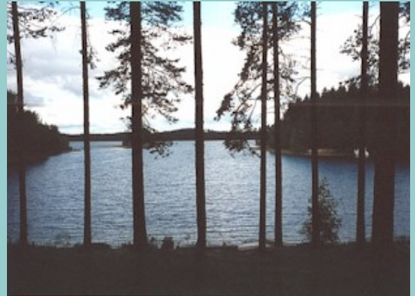
Näkymä laguunin suulle