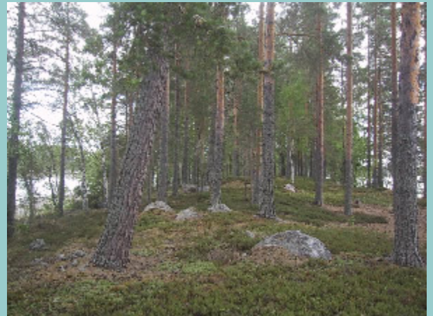
Saaren maasto on retkeilyyn erittäin sopivaa.