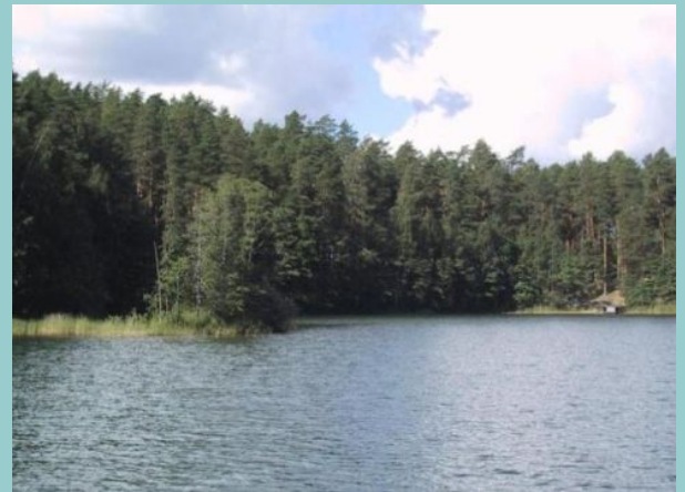
Punkaharjun suojaisa lahden poukama.