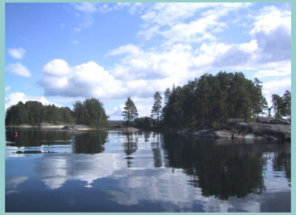
Savonsaarten ympäristö muistuttaa Pihlajaveden maisemia.