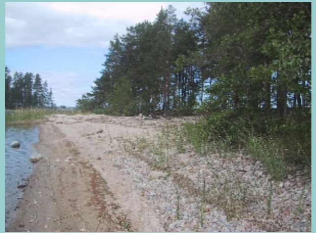
Kaunis hiekkaranta kauniissa saaristossa.